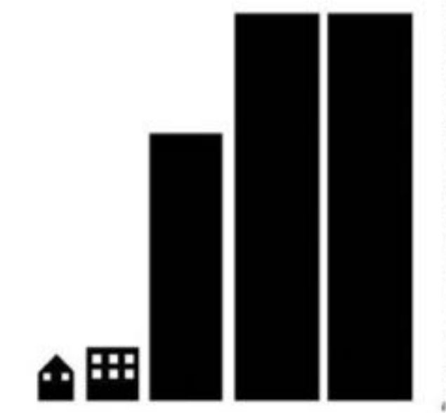
Pas de tours dans ma cour

Le mouvement Pas de tours dans ma cour s'opposait à la construction d'un méga complexe résidentiel de 300 condos de luxe sur le site du Commodore afin d'assurer un accès public à la berge.